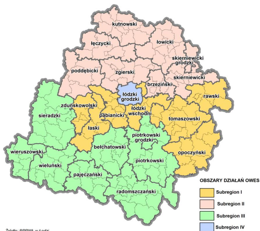
Mapa 2. Podział województwa łódzkiego na subregiony