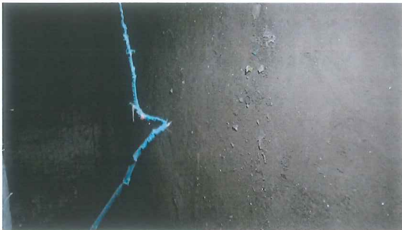
Rysunek 2 - zdjęcie uszkodzenia zlokalizowanego pod oddziałem zakaznym

Infratel Sp. z o.o. ul. S. Kuropatwińskiej 16, 95-100 Zgierz tel. +48 (42) 656-40-88 | fax. +48 (42) 288-40-37 email: info@infratel.pl | www.infratel.pl